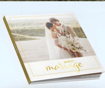
LIVRE PHOTO PRESTIGE