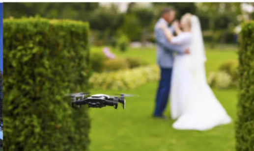
LIVRE PHOTO PRESTIGE