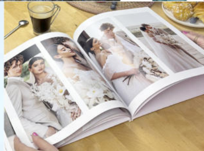
LIVRE PHOTO PRESTIGE