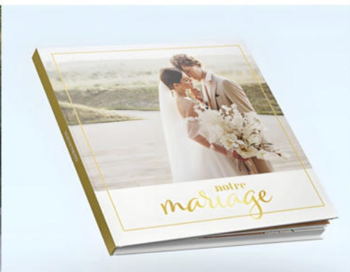
LIVRE PHOTO PRESTIGE