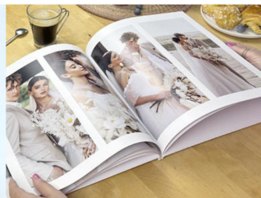
LIVRE PHOTO PRESTIGE