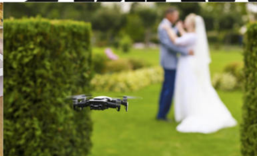
LIVRE PHOTO PRESTIGE