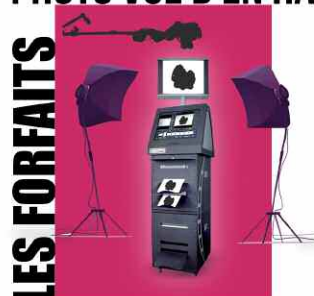
PHOTO VUE D'EN HAUT

200 photos formats 10x15 cm - 3 heures : 450,00 €